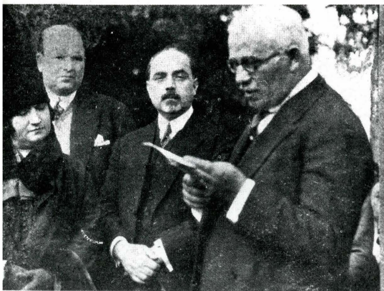
5. Mircești, 1928. Solemnitatea dezvelirii mausoleului lui Vasile Alecsandri. Moment din timpul discursului lui Alexandru Lapedatu.

nisterului Cultelor și Artelor, la sfârșitul lunii iulie 1927 20 . Astfel, la punctul 3, Paul Molda susține că: „[...] în această construcție, cinstindu-se memoria unuia din marii noștri poeți, se va căuta și prin pictură a se reprezenta părțile din opera sa cele mai expresive ca viața românească, cîntate de el, ca secerișul, cositul, aratul și altele“. Iar la punctul următor stipula: „Se vor reprezenta subiectele relative la viața și gloriificarea poetului, precum și o alegorie V. Alecsandri între comedie și poezie, cele două părți principale ale activității sale“. Alecsandri luînd parte la acele „Jeux Aloroux din Toulouse“, concursuri și manifestări literare ale poezilor provenșali cu Mistral și ceilalți, ale căror sărbători erau Alecsandri, Cîntecul Gintei Latine și Alecsandri între scriitorii români contemporani. Referitor la distribuția subiectelor, pictorul Paul Molda preconiza să procedeze astfel: „[...] în bolta turlei și pe bolta altarului, în sferele cele de sus se vor face scenele religioase, de altfel chiar arhitectura le cere. În semibolți, în spațiile mediane, se fac alegorii și subiectele de mărire a poetului. În panourile cele de jos, în imediat contact cu pămîntul, se fac scenele din viața românească“.